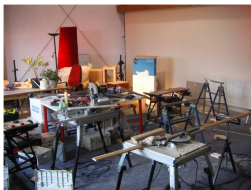
De concertzaal "in de steigers".

We hopen natuurlijk dat dit extra cachet gaat geven aan onze concerten.